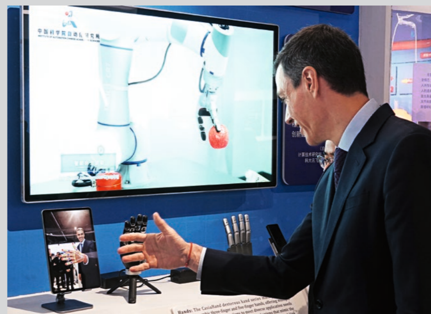
13 de abril de 2026. Pedro Sánchez, presidente de España, se presenta en una exposición de proyectos científico-tecnológicos de la Academia China de Ciencias, donde recibe el título de profesor honorario de la Universidad de la Academia China de Ciencias.

CON su cuarta visita en cuatro años consecutivos, Pedro Sánchez se ha convertido en uno de los líderes globales con mayor interlocución con China. En un momento de serias tensiones geopolíticas internacionales —como las que se viven en el estrecho de Ormuz—, el presidente del Gobierno español ha redoblado su apuesta por el diálogo con China y por la defensa del multilateralismo. Esta cuarta visita debe entenderse también como la expresión de ese paso adelante que el Gobierno español ha señalado queriendo dar en su relación con Beijing y cuyo marco quedó establecido en el Plan de Acción 2025-2028. En