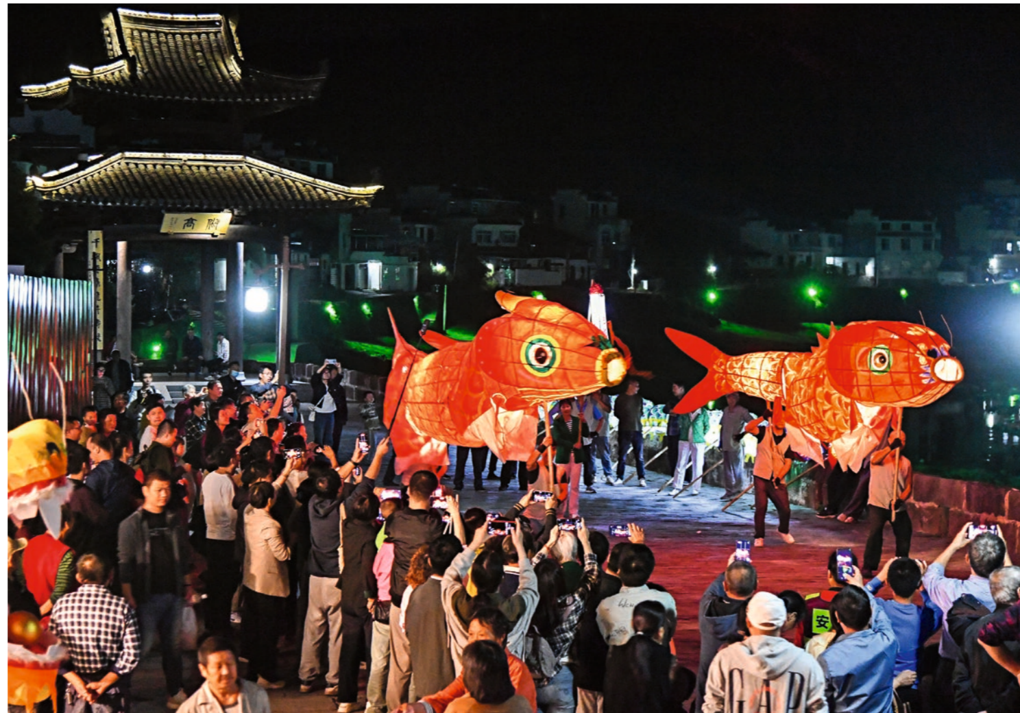
4 de octubre de 2024. Turistas contemplan el espectáculo local “Linternas de Peces” en la calle Yuliangba, distrito de Shexian, provincia de Anhui. Wei Yao

Los restaurantes de estilo antiguo se han multiplicado en las grandes ciudades chinas. Aunque estos locales manejan algunos de los precios más altos del mercado, rara vez están vacíos.