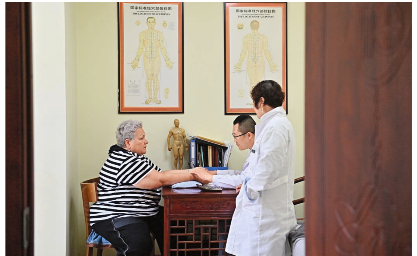
30 de mayo de 2025. Una turista rusa en una clínica de medicina tradicional china en la ciudad de Hunchun, provincia de Jilin.