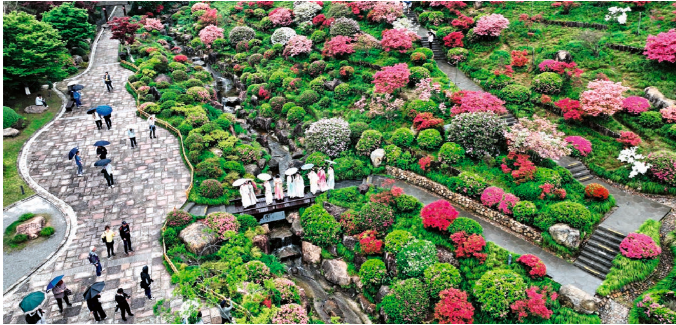
11 de abril de 2026. Visitantes contemplan las azaleas en el Valle Fantástico de Xiazhuo, en el distrito de Deqing, ciudad de Huzhou, provincia de Zhejiang.

el panorama del turismo primaveral ha incluido varias tendencias adicionales: el auge de destinos de nicho, la creciente preferencia por estancias cortas en alojamientos tipo homestay y la aparición de viajes de larga distancia para ver flores a bajo costo.