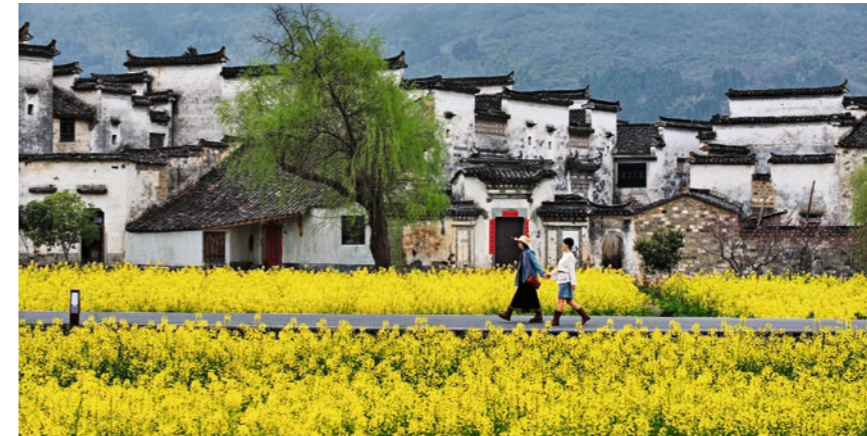
20 de marzo de 2026. Dos turistas dan un paseo entre un campo de flores en la aldea de Guanlu, distrito de Yixian, ciudad de Huangshan, provincia de Anhui.

A medida que la primavera se extiende por China, mares de flores comienzan a florecer de forma secuencial de sur a norte. Este espectáculo natural anual ha consolidado la “apreciación de las flores” como una parte esencial del turismo primaveral, impulsando la actividad en todo el sector turístico.