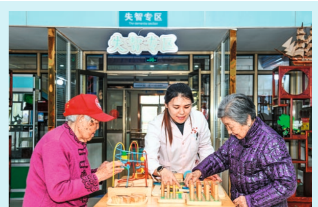
25 de marzo de 2026. Una enfermera ayuda a dos residentes mayores con ejercicios cognitivos en el hogar de ancianos Huaifurun, ciudad de Jiaozhou, provincia de Shandong.