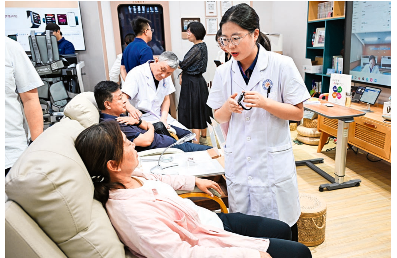
13 de septiembre de 2025. Equipos de servicios de atención domiciliar para personas mayores captan la atención de los visitantes en la Feria Internacional de Comercio de Servicios de China celebrada en Beijing. Wei Yao

E N una conferencia nacional sobre el sector servicios celebrada en Beijing los días 7 y 8 de abril, el primer ministro Li Qiang hizo un llamado a implementar iniciativas destinadas a expandir la capacidad y mejorar la calidad del sector. Asimismo, afirmó que deben realizarse esfuerzos con el fin de avanzar hacia una mayor especialización en los servicios a los productores, como también en el extremo superior de la cadena de valor, y fomentar servicios al consumidor de alta calidad, diversificados y accesibles.