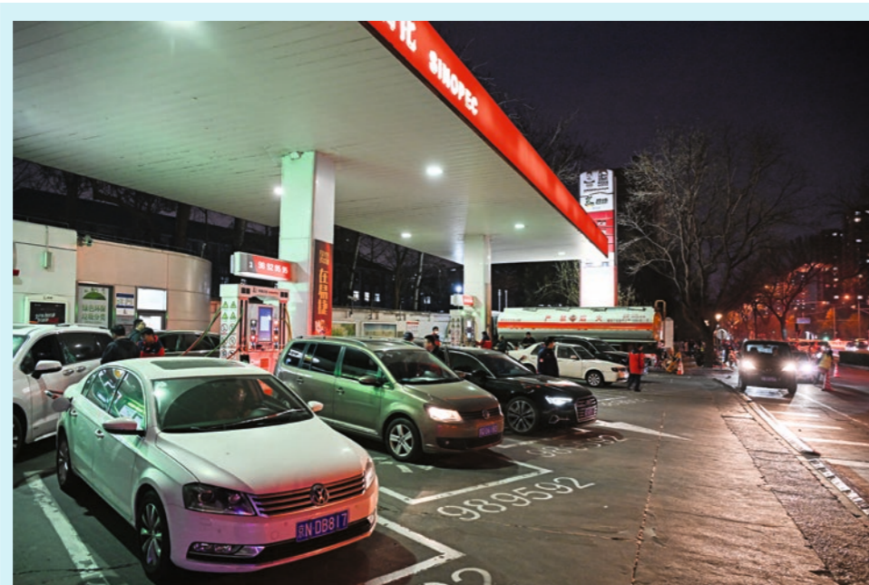
23 de marzo de 2026. Automóviles hacen fila en una gasolinera de Sinopec en el distrito de Xicheng, Beijing. Wei Yao

"Instamos a la parte japonesa a reflexionar profundamente sobre su historia de militarismo y agresión, cumplir su compromiso y actuar con prudencia en los ámbitos militar y de seguridad, y evitar seguir por el camino equivocado", añadió Mao Ning en una conferencia de prensa regular.