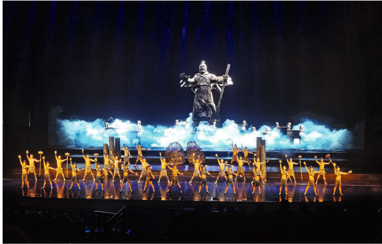
1 de junio de 2025. Representación temática “Arriba y abajo del río Amarillo”, celebrada en el Gran Teatro Hualin en el distrito de Qihe, Dezhou, provincia de Shandong.

del turismo inmersivo, la economía de la experiencia también está creando espacios más íntimos y silenciosos a través de la artesanía manual.