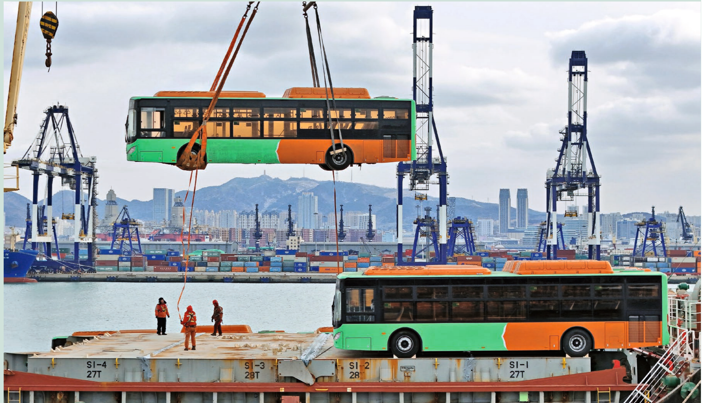
6 de febrero de 2026. Autobuses a gas natural son cargados a un barco con destino a México en el puerto de Yantai, provincia de Shandong.

Los espectadores disfrutaron durante más de una hora de coreografías milimétricas interpretadas por 16 y 17 bailarines respectivamente, basadas en la técnica de movimiento circular creada por los fundadores Tao Ye y Duan Ni.